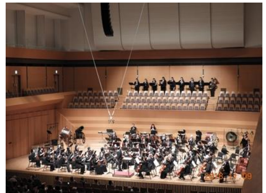
杉並公演(アマチュアオーケストラ)