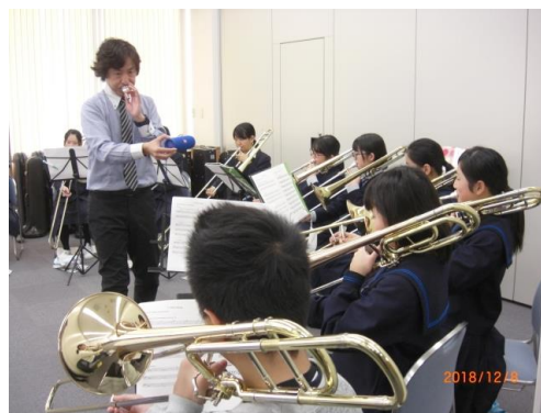
東近江公演(楽器演奏クリニック)